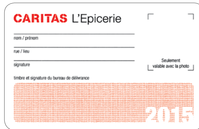
Exemple d'une carte de légitimation

Les bons de CHF 10.- sont vendus au prix coûtant aux partenaires qui les distribuent.